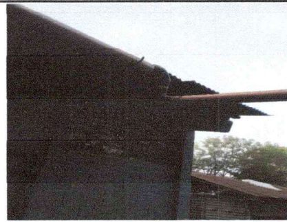
Foto 2: Se observa que el canal que sirve para la recolección de agua está en mal estado