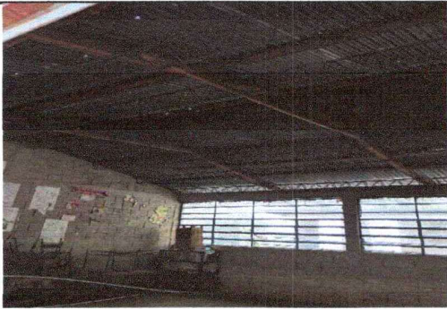
Foto 1: Se observa deterioro de láminas, las vigas de madera invisibles en modulo 1.