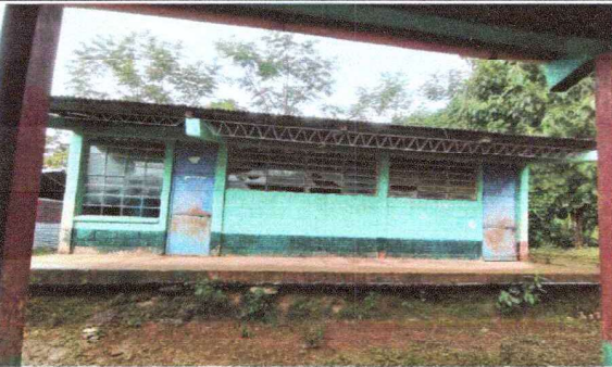
Foto 3: Se observa el muro de tierra que sostiene al modulo en mal estado.